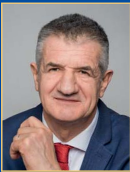
Candidat : Jean Lassalle Parti : RÉSISTONS !