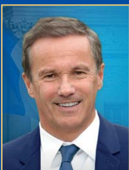
Candidat : Nicolas Dupont-Aignan Parti : Debout la France (DLF)

L'objectif de « zéro personne à la rue en 2030 » est louable, mais sa concrétisation repose sur une triple nécessité : nécessité de trouver des solutions durables pour lutter contre la pauvreté et la précarité, nécessité de mobiliser des ressources financières importantes et nécessité de coordonner les efforts des États membres de l'Union européenne. Ayant toujours vécu à la campagne, je porte en moi les valeurs rurales et l'identité paysanne. Ces enseignements m'ont inculqué la dureté de la vie, le pragmatisme, et surtout, le principe fondamental qui guide notre action politique : la solidarité. À cet égard, nous, en tant que représentants de la ruralité, sommes les mieux positionnés pour faire de cet objectif une réalité.